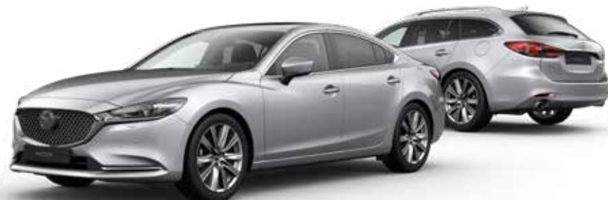
SONIC SILVER METALLIC