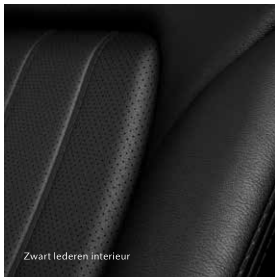
Zwart lederen interieur