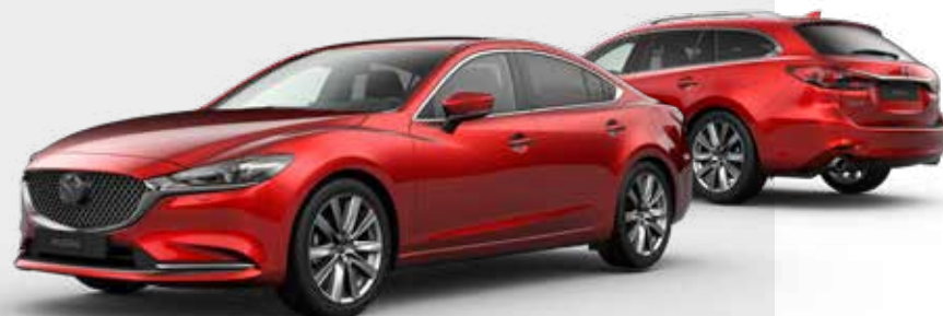
SOUL RED CRYSTAL METALLIC