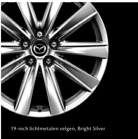
19-inch lichtmetalen velgen, Bright Silver