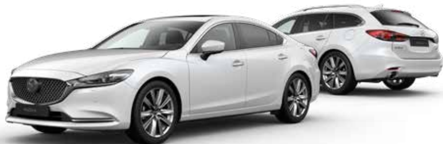
SNOWFLAKE WHITE PEARL