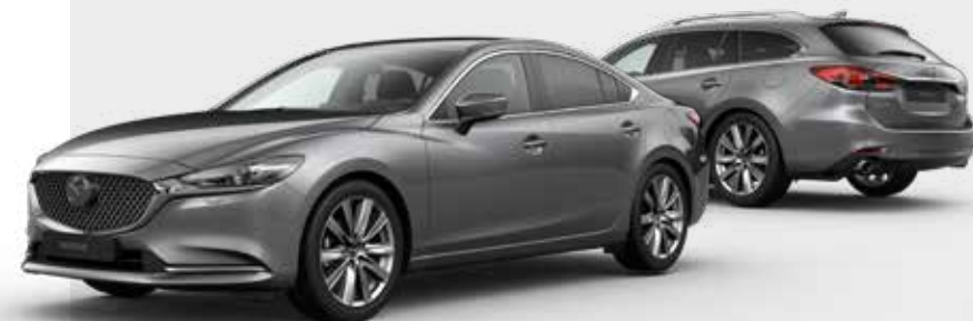
MACHINE GRAY METALLIC