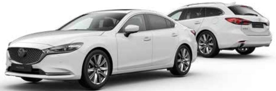
ARCTIC WHITE SOLID

Bekijk de Mazda6 Sportbreak in 360 graden