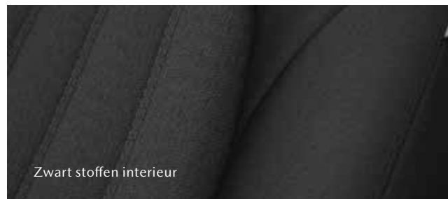
Zwart stoffen interieur