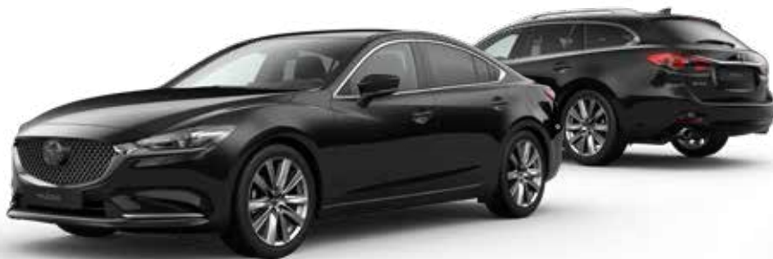
JET BLACK MICA

Je hebt de keuze uit tien kleuren. Arctic White Solid vormt de basis. Machine Gray Metallic en Soul Red Crystal Metallic zijn het meest exclusief. Een speciale laktechniek met nog kleinere en heldere aluminiumdeeltjes zorgt voor een ongekend diepe, heldere kleur.