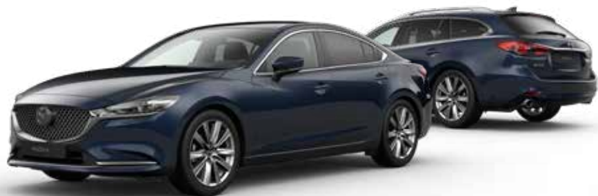
DEEP CRYSTAL BLUE MICA