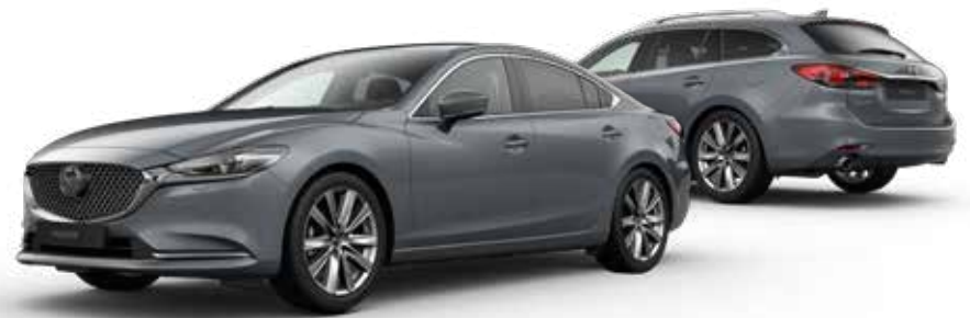
POLYMETAL GRAY METALLIC