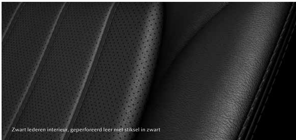
Zwart lederen interieur, geperforeerd leer met stiksel in zwart