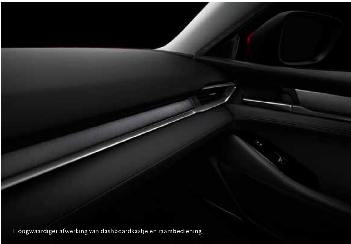
Hoogwaardiger afwerking van dashboardkastje en raambediening