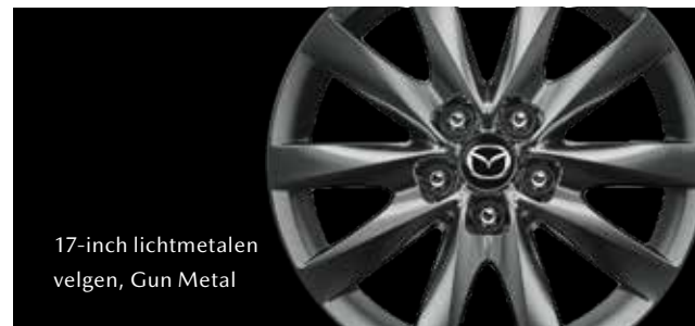
17-inch lichtmetalen velgen, Gun Metal