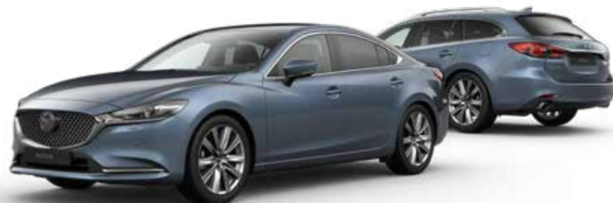
BLUE REFLEX MICA