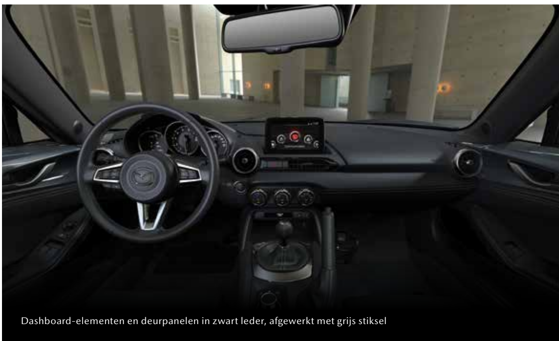
Dashboard-elementen en deurpanelen in zwart leder, afgewerkt met grijs stiksel