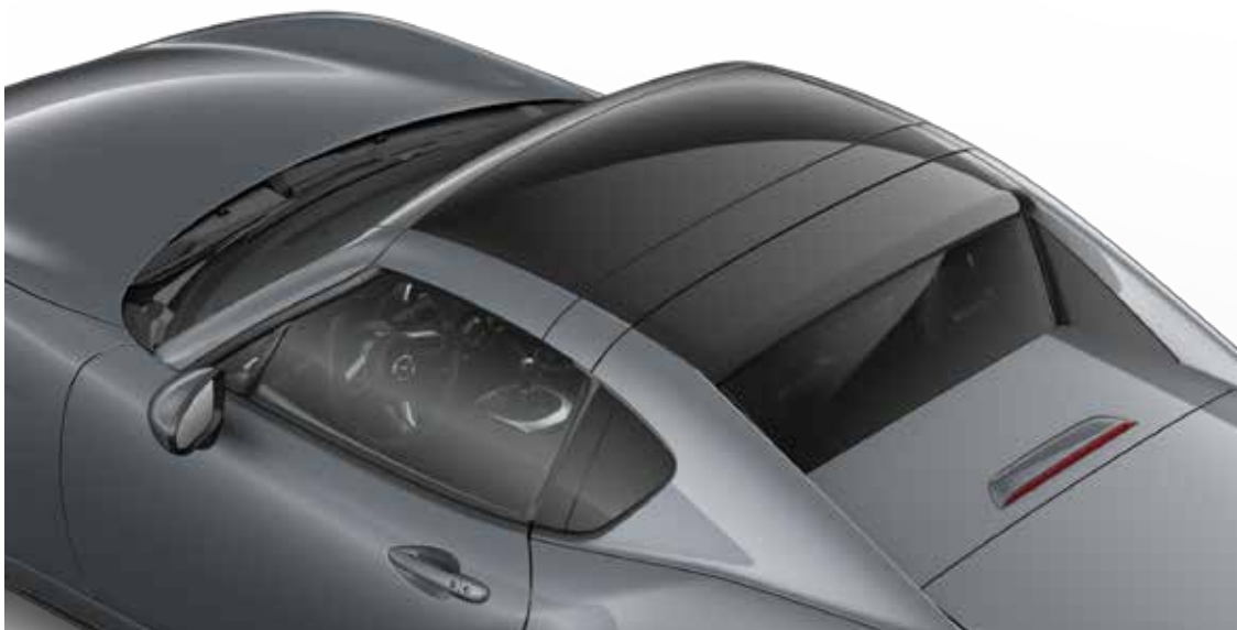
Mazda MX-5 RF Sportive in Polymetal Gray met Twin Tone dak