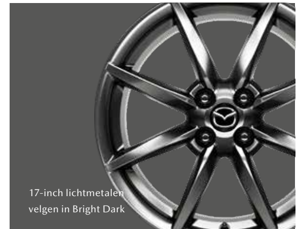
17-inch lichtmetalen velgen in Bright Dark