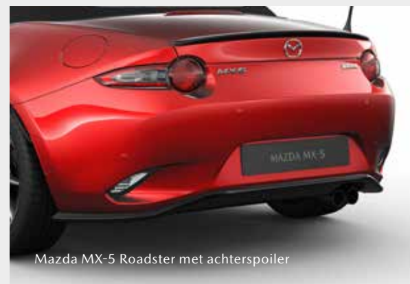
Mazda MX-5 Roadster met achterspoiler