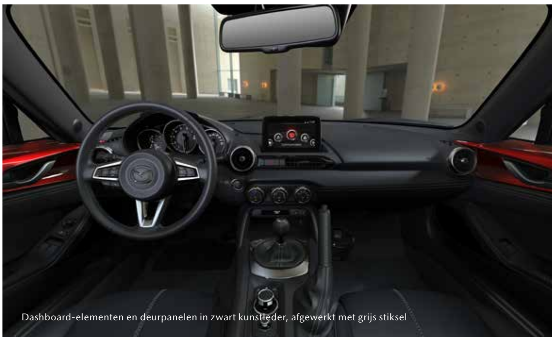
Dashboard-elementen en deurpanelen in zwart kunstleder, afgewerkt met grijs stiksel