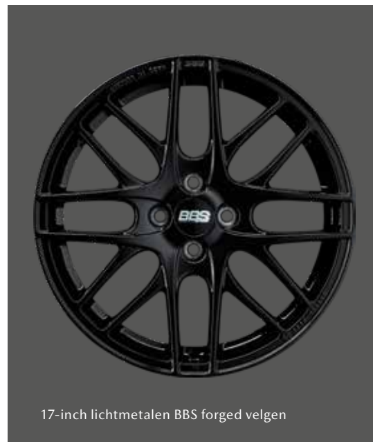
17-inch lichtmetalen BBS forged velgen