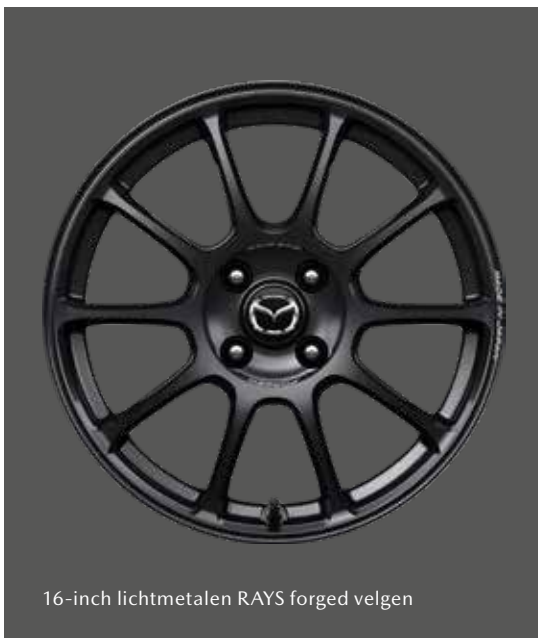
16-inch lichtmetalen RAYS forged velgen