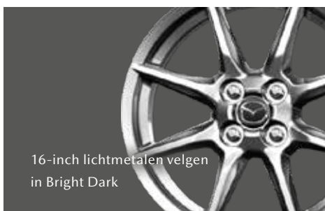
16-inch lichtmetalen velgen in Bright Dark