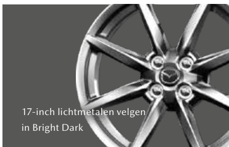
17-inch lichtmetalen velgen in Bright Dark