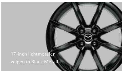
17-inch lichtmetalen velgen in Black Metallic