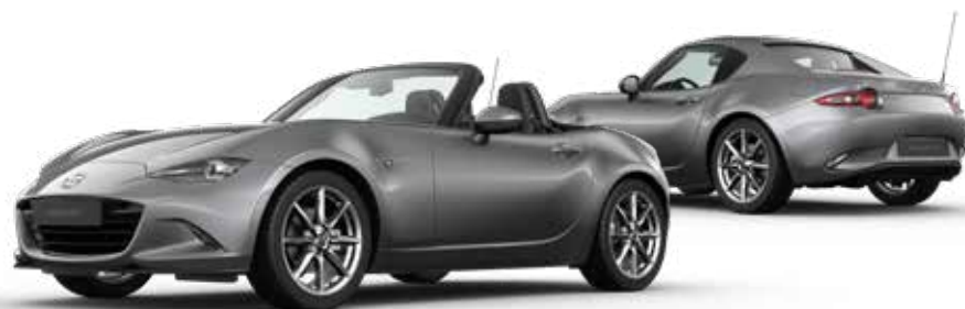
MACHINE GRAY METALLIC