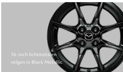
16-inch lichtmetalen velgen in Black Metallic