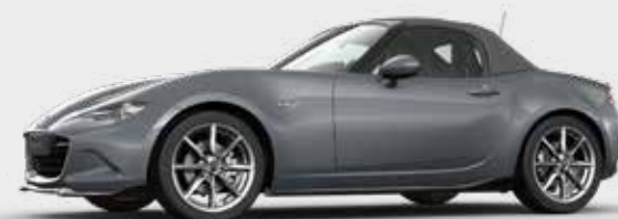
Mazda MX-5 Roadster met Sport Pakket