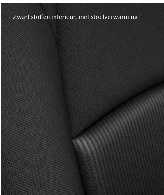
Zwart stoffen interieur, met stoelverwarming