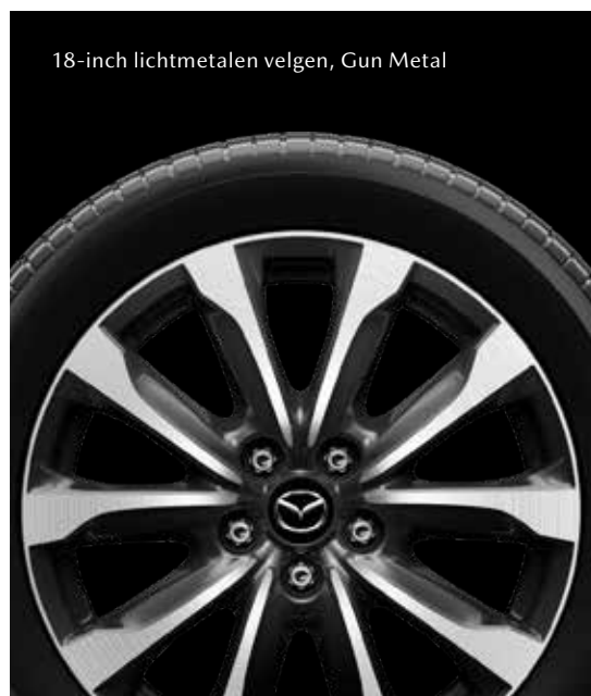
18-inch lichtmetalen velgen, Gun Metal