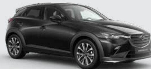
Mazda CX-3 met Sport pakket