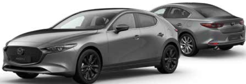
MACHINE GRAY METALLIC € 1.000