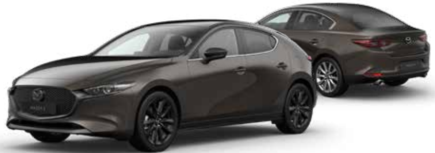
TITANIUM FLASH MICA