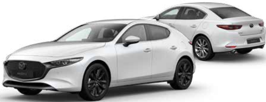
SNOWFLAKE WHITE PEARL € 800