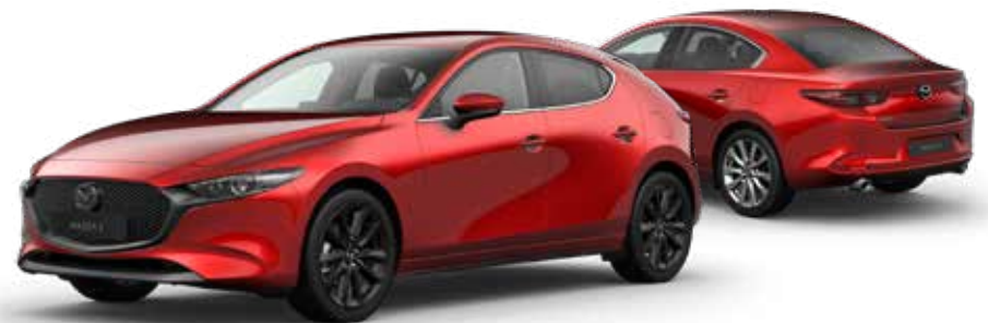
SOUL RED CRYSTAL METALLIC € 1.150