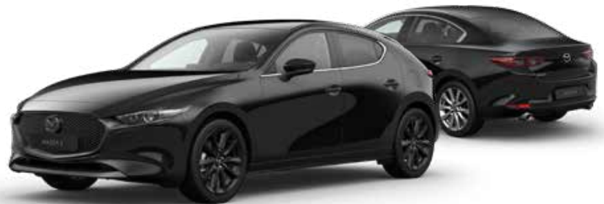
JET BLACK MICA