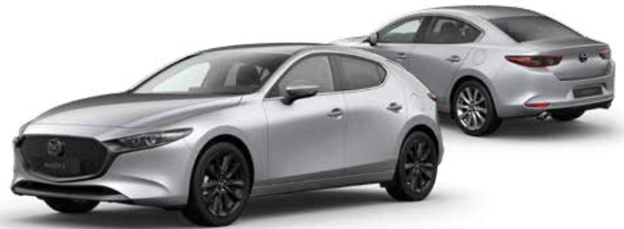
SONIC SILVER METALLIC € 800