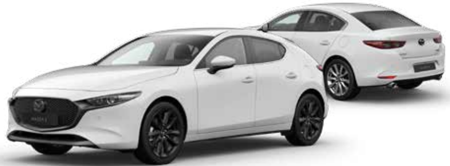
ARCTIC WHITE SOLID

Informeer bij je Mazda dealer naar de actuele voorraad en beschikbaarheid.