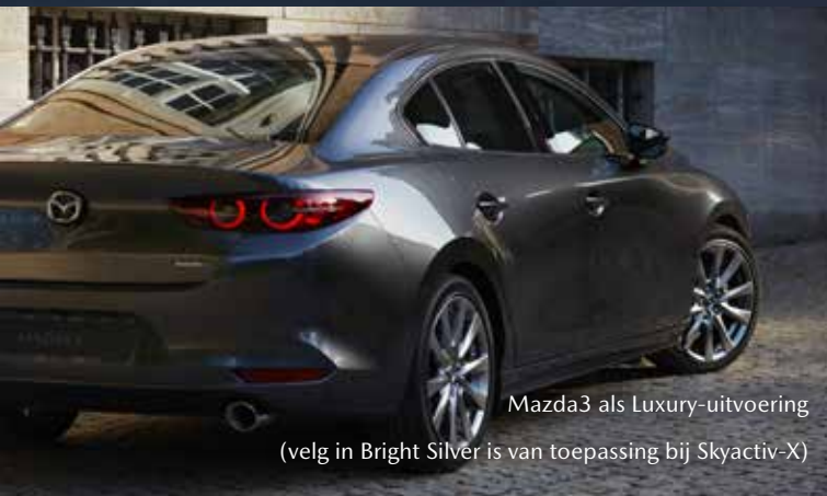
Mazda3 als Luxury-uitvoering (velg in Bright Silver is van toepassing bij Skyactiv-X)