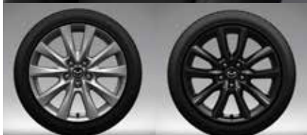
Bright Silver (Sedan) Black (Hatchback)