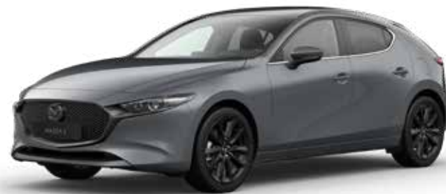
POLYMETAL GRAY METALLIC (enkel beschikbaar op Hatchback) € 800