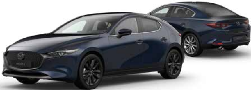
DEEP CRYSTAL BLUE MICA € 800