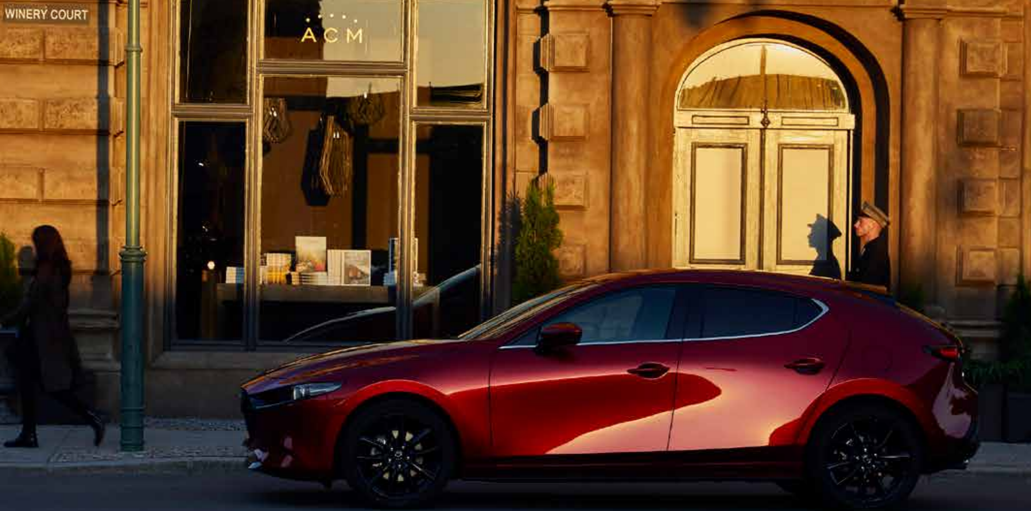
Mazda3 als Luxury-uitvoering (velg in Black is van toepassing bij Skyactiv-X)